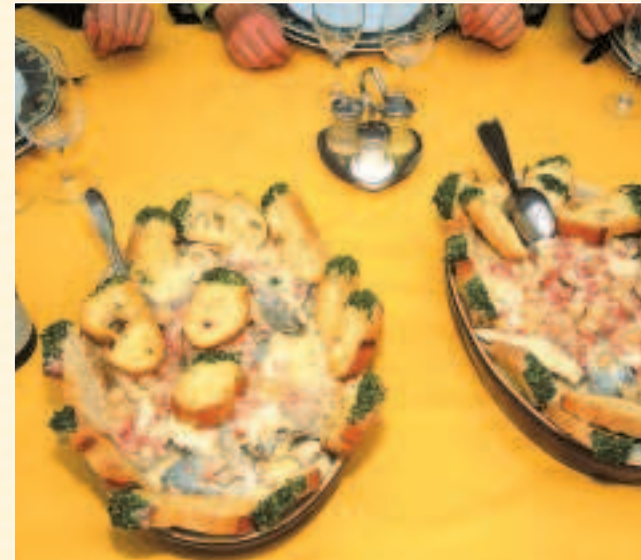
Autour d'une "pochouse".